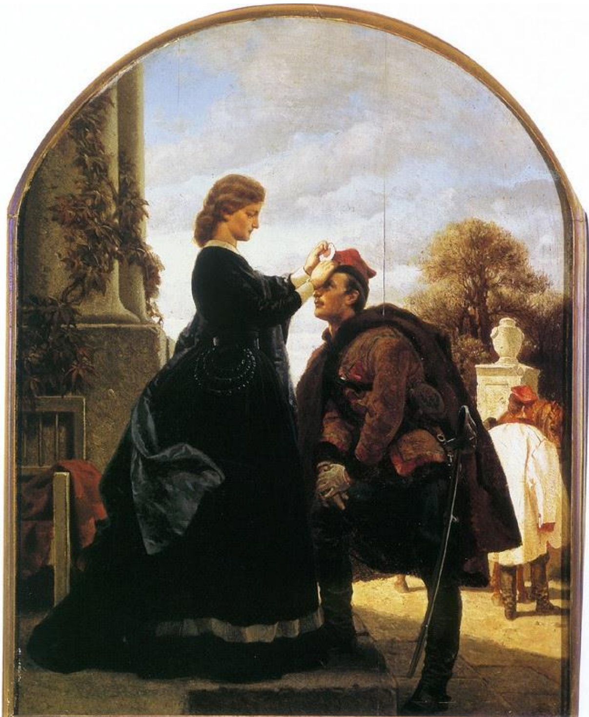
Zadanie 4. Namalowany w 1866 roku przez Artura Grottgera obraz pt. „Pożegnanie powstańca” to jedna z najbardziej znanych ilustracji Powstania Styczniowego. Proszę opisz przedstawioną przez malarza scenę.